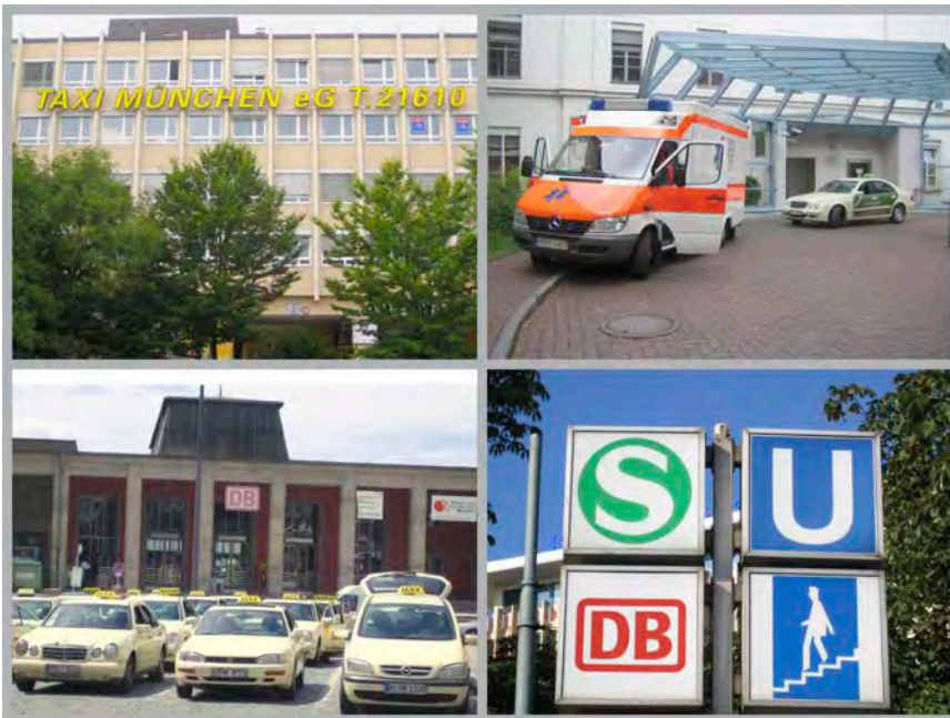
Eine Taxizentrale von heute versteht sich als modernes Dienstleistungsunternehmen.

Der Taxifuhrpark ist in München das größte, individuellste und flexibelste Transportunternehmen, mit 24 Stunden Bereitschaft. Dieses Potential muss viel besser genutzt werden. Die Kundschaft wartet schon.